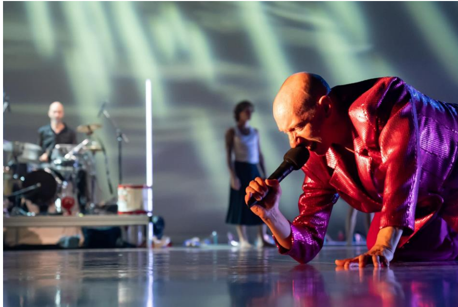
( Cabaret Deconstruit )

Ten slotte vond met LeineRoebana een goedbezochte avond in het Amsterdamse Vondelpark plaats, met verzameld werk van beide instellingen: LOST .