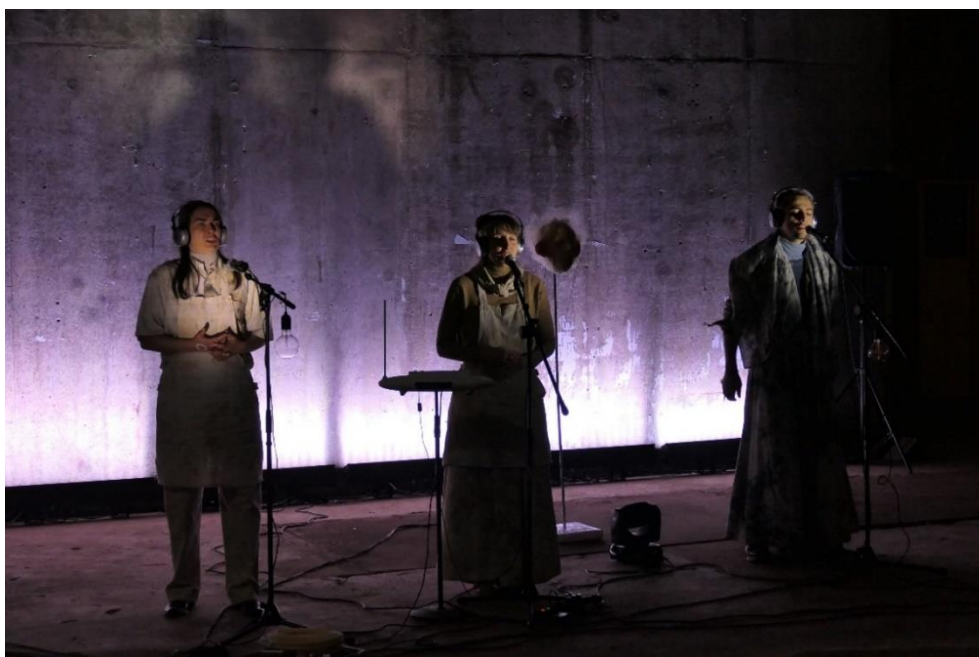
( Through Bone and Marrow in BRUTUS Rotterdam)