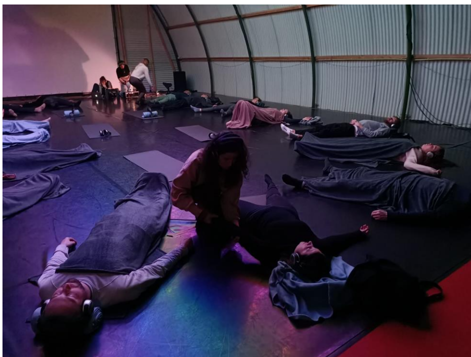
(Deep Sound Experience in Bloos Breda)

In de loop van 2023 bond Dyane Donck Company twee mensen aan zich, die in het yogacircuit resp. het theater- en festivalcircuit onderzoek doen naar de verkoopmogelijkheden van Deep Sound Experience . De resultaten van deze onderzoeken zullen vanaf 2024 volgen.