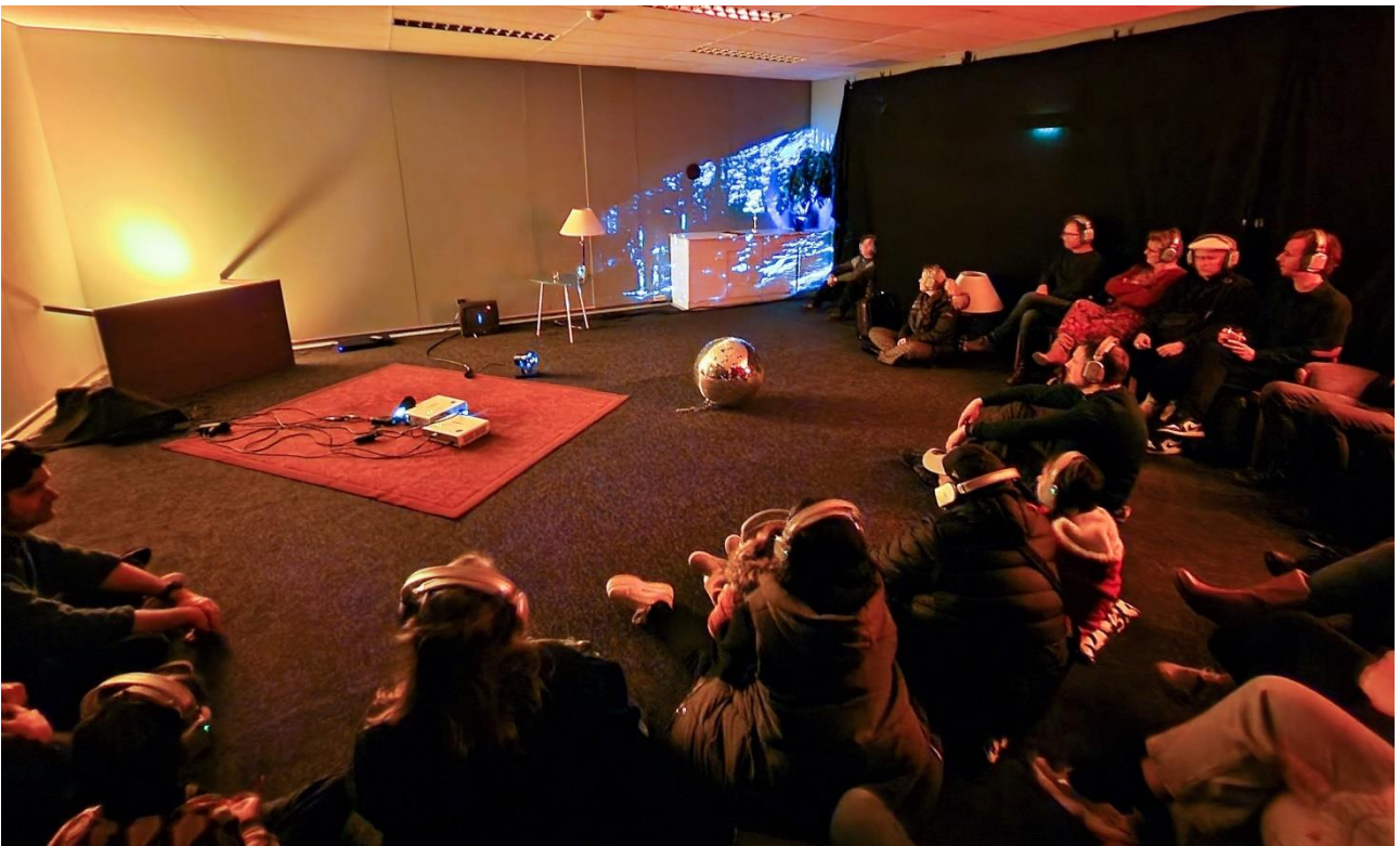
( Sound Gems: The Forest in Bloos Breda)